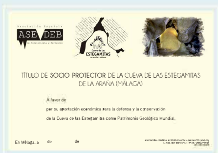
Diploma en papel verjurado y fichero digital