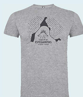
Camiseta color arena o color gris