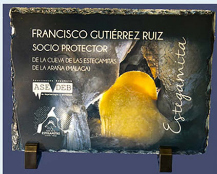
Placa 14 x 19 cm personalizada en roca

* Especial (Donación de 100 €) - Recompensas a recibir: